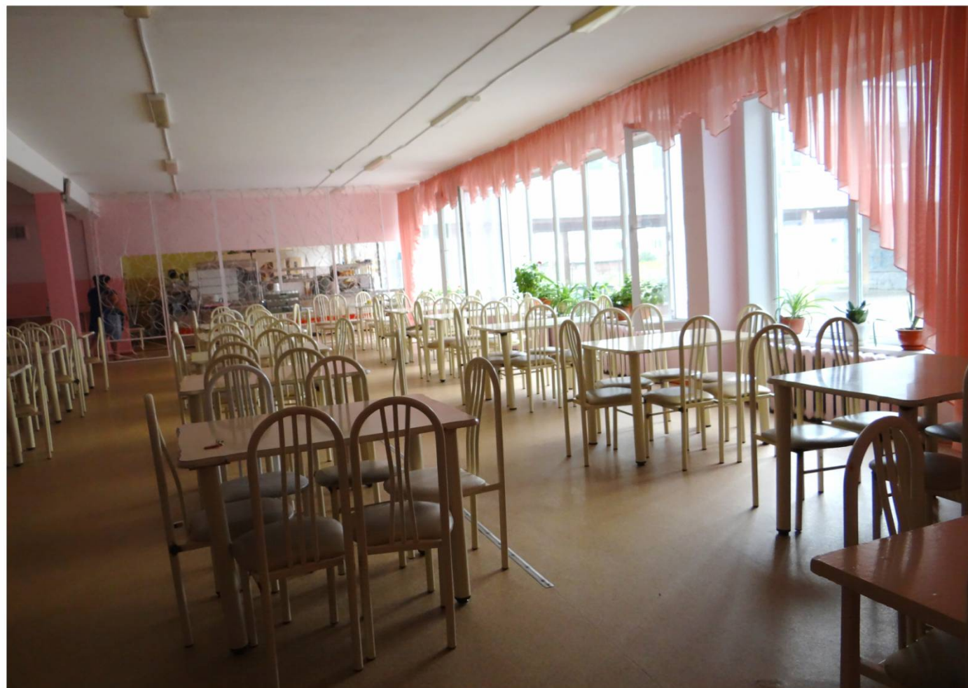
Столовая рассчитана на 120 мест