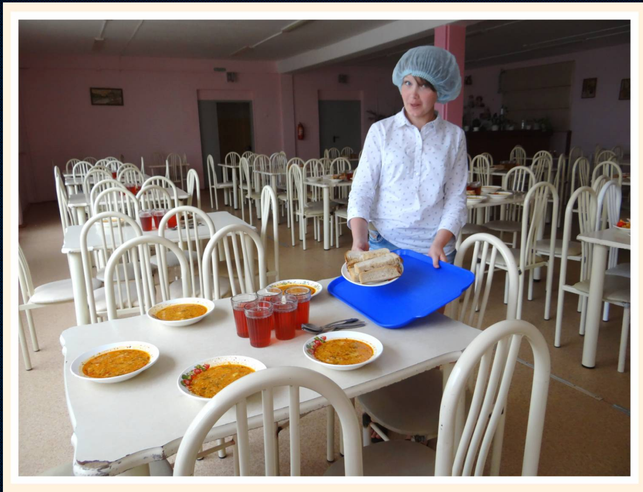
Дежурная по столовой