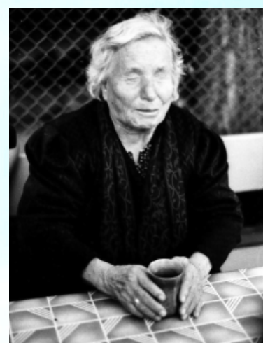
Вангелия Пандева Гуштерова (Ванга); (1911-1996)

Так, святец Сергей однажды сказал ей: «Нет такой силы, которая могла бы сломить Россию. Россия будет развиваться, расти, крепнуть».