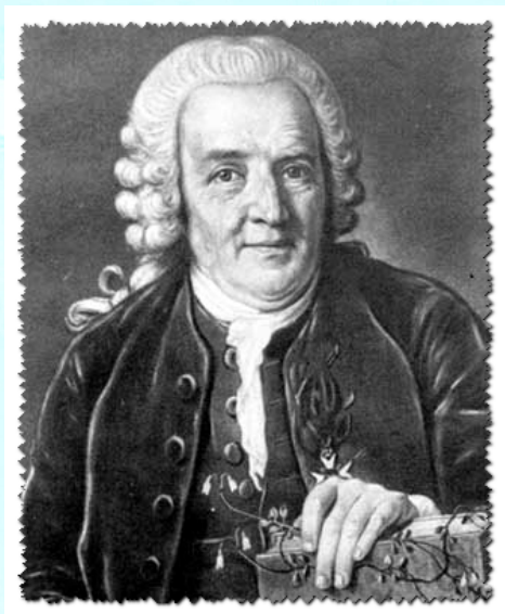
Филипп Ауреол Теофраст Бомбаст фон Гогенгейм (Парацельс; 1493-1541)

Еще римский врач и астролог Парацельс в своих «Оракулах» говорил: «Есть один народ, который Геродот называл гипербореями - прародителями всех народов и всех земных цивилизаций...Нынешнее название исконной земли этого древнего народа - Московия. Гипербореи в своей бурной будущей истории познают много – и страшный упадок с великим множеством всевозможных бедствий, и мощный великий расцвет с великим множеством всевозможных благ, который наступит уже в начале XXI века».