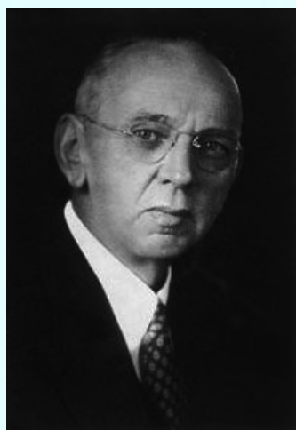
Эдгар Кейси (1877-1945)

Прогнозы знаменитейшего американского предсказателя Кейси : «США и Европу ждут серьезные изменения. Земля будет расколота в западной части Америки. Большая часть Японии должна погрузиться в море. Верхняя часть Европы будет изменена в мгновение ока. Будут изменения в Арктике и в Антарктике, что приведет к извержению вулканов в жарких областях, и будет сдвиг полюсов - такой, что холодный климат станет тропическим, и там будут расти мох и папоротник».