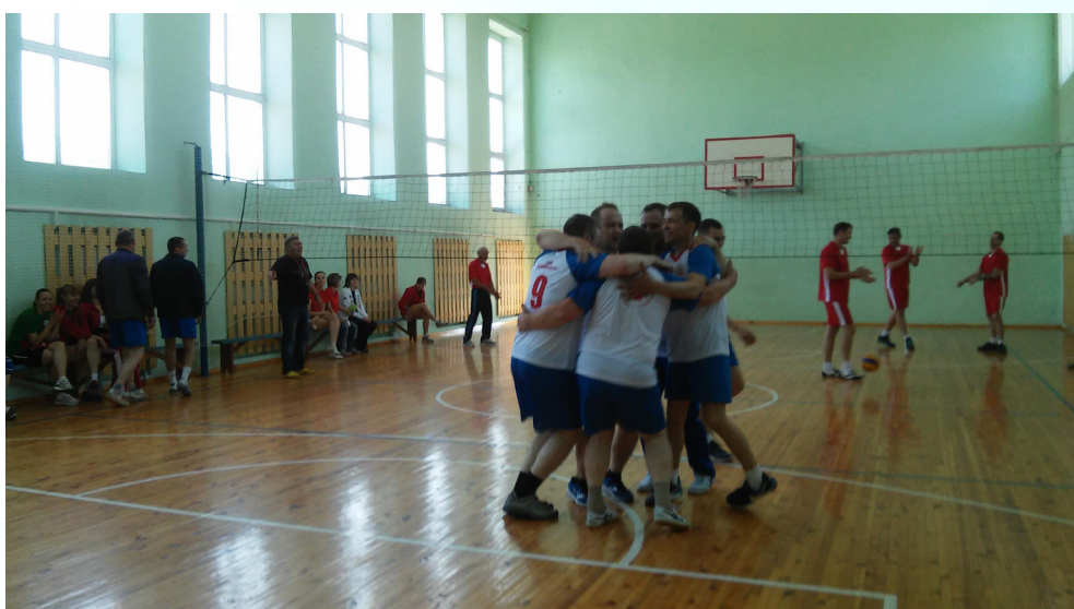
Мужская команда волейболистов - радуются победе!