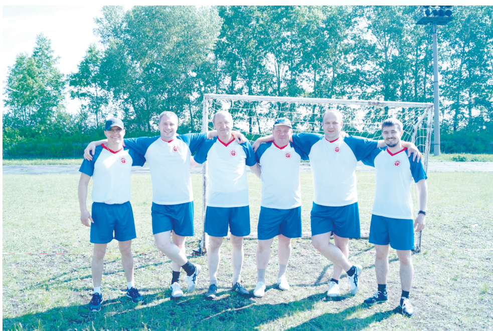
Мини-футбол - не Боги горшки обжигают!

Команда КГБУЗ «Кежемская РБ» - так как спортивное мероприятие было посвящено 70-летию Победы в Великой Отечественной войне - украшением нашей колонны были белые голуби - символ Мира, которые около трибуны были отпущены в небо - символ Свободы. В руках медиков остались шары голубого и зеленого цвета - Символы чистого мирного голубого неба и проснувшейся, после долгой зимы, природы.