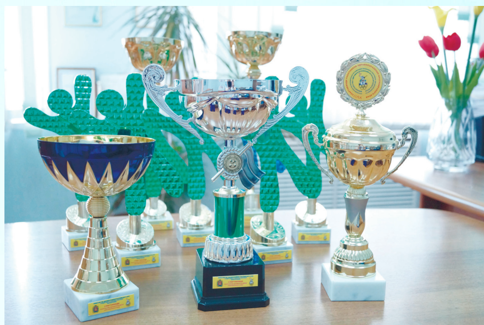
Команда заработала 10 кубков и 32 медали!