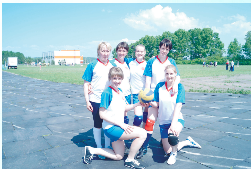
Теперь можно и сфотографироваться - серебро наше!