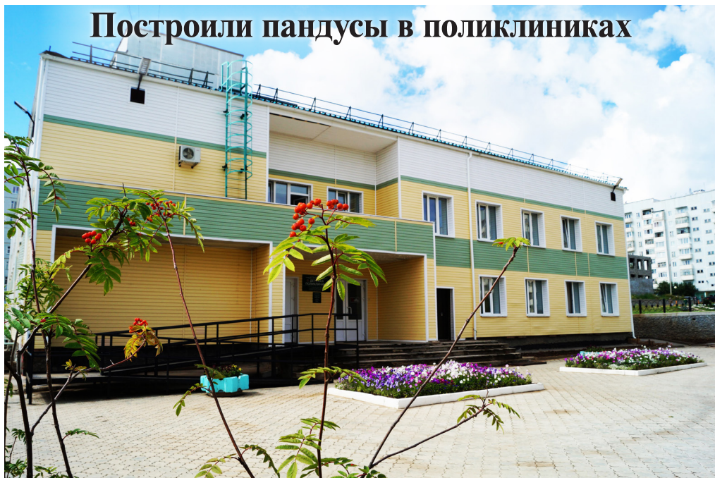
Построили пандусы в поликлиниках